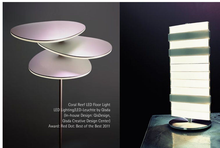
Coral Reef LED Floor Light LED Lighting/LED-Leuchte by Qisda (In-house Design: QisDesign, Qisda Creative Design Center) Award: Red Dot: Best of the Best 2011

Darfon Lighting | Nexgen Mediatech | Pegatron | Qisda