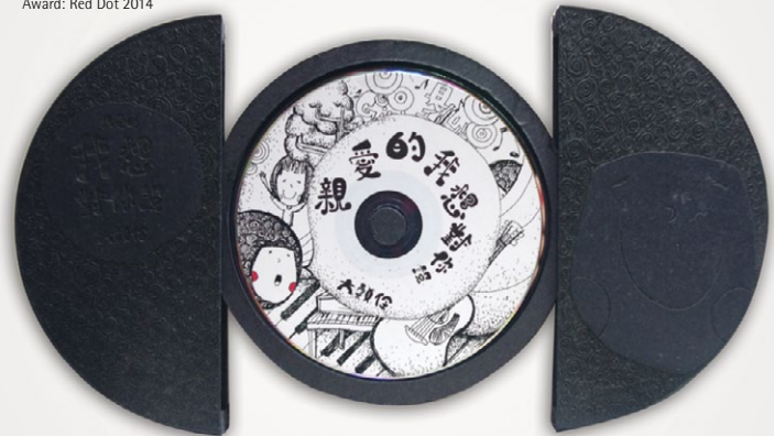
LET ME TELL YOU, MY DARLING Music album package/Verpackung Musik-Album by Tzu-Ling Kuo Award: Red Dot 2014