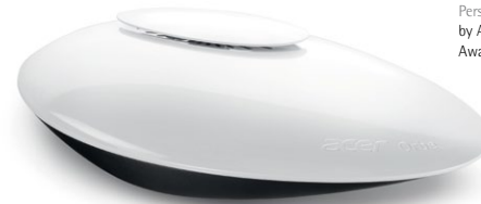
ACER ORBE Personal Cloud Storage/ Persönlicher Cloud-Speicher by Acer (In-house Design) Award: Red Dot 2013