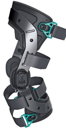
OPPO FORCE-IN-ONE Knee brace/Kniebandage by OPPO Medical Corporation (In-house Design: Fu-Lin Chuang, Chien-Min Fang) Award: Red Dot 2014