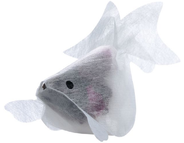
GOLDFISH Tea bag/Teebeutel by CHARM VILLA Award: Red Dot 2014

Active Creative Design | David Lai Workshop | I'DER Visual Image Design | MAGIC CREATIVE | Mu Creatives | Proad Identity | Tzu-Ling Kuo