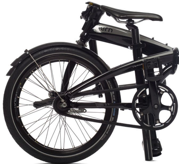
TERN VERGE DUO Folding Bicycle/Faltrad by Tern Bicycles (In-house Design: Joakim Uimonen, Joshua Hon) Award: Red Dot 2012