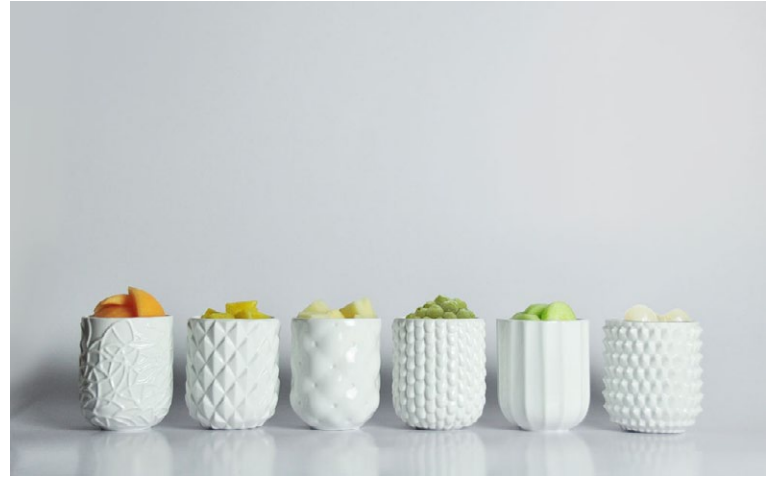
FRUIT AND VEGETABLE PEELS Ceramic Cups/Keramikbecher by HXH Group (Design: ViICHEN DESIGN) Award: Red Dot 2013, Golden Pin Design Award 2013

Design hilft nicht nur Unternehmen, Sichtbarkeit und Wiedererkennbarkeit zu erzeugen und somit eine eigene Identität aufzubauen. Auch für Taiwanese selbst ist ihr ursprüngliches Design ein markantes Zeichen der Identität des Landes. Zeitgemäße Interpretationen traditioneller Elemente zeugen in verschiedenen Lifestyle-Produkten von der taiwanesischen Kultur.