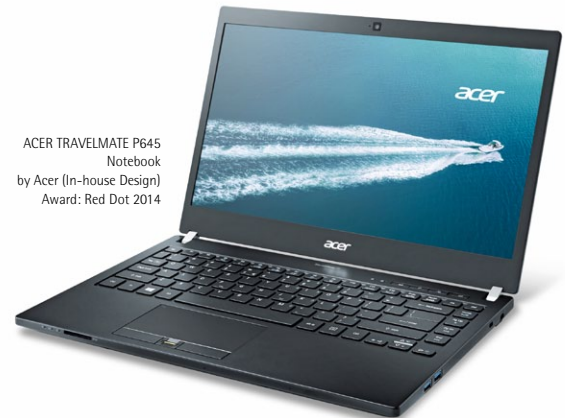
ACER TRAVELMATE P645 Notebook by Acer (In-house Design) Award: Red Dot 2014