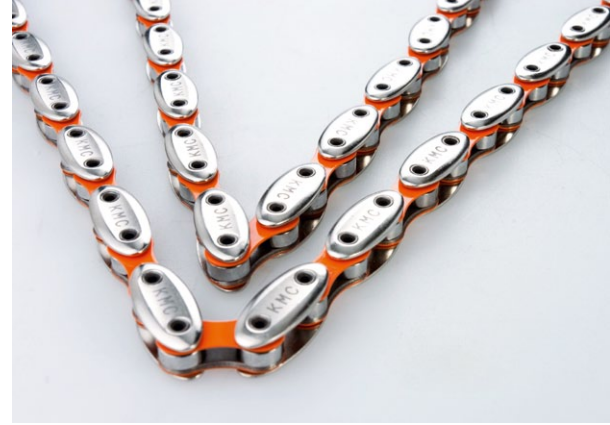
CITY HUNTER Bicycle Chain/Fahrradkette by KMC Chain Industrial (In-house Design: Steven Yang) Award: Red Dot 2014

Taiwan zählt heute zu den größten Fahrradherstellern weltweit. Dementsprechend fokussierte sich die Designentwicklung mit der Zeit auch verstärkt auf die Gestaltung des Zweirads und der dazugehörigen Accessoires.