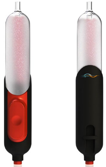
OCEAN LIFE Desalination Life-Saving Straw/ Salz-/Trinkwasser-Notaufbereiter by Industrial Technology Research Institute (In-house Design: Yung-Jen Cheng, Hung-Cheng Yen, Tung-Chuan Wu, Chan-Hsing Lo & Design: TWO+ GROUP) Award: Honourable Mention 2014