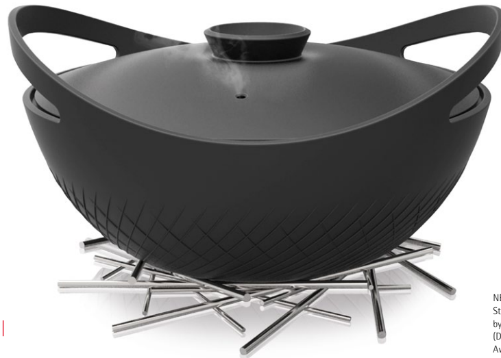
NEST Stewpot/Schmortopf by Shu&W's Cera (Design: 3+2 Design Studio) Award: Red Dot 2014

3+2 Design Studio | Proad Identity | ViICHEN DESIGN | WE+ CREATE