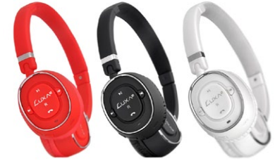
LUXA2 BT-X3 Bluetooth Stereo Headphones/ Bluetooth-Kopfhörer by Thermaltake Technology (In-house Design: ItDesign) Award: Red Dot 2012

Acer | AHOKU Electronic | ASUSTeK Computer | Avison | AzureWave Technologies | BenQ | Calibre Style | Conary Enterprise | Cooler Master | Darfon Electronics | D-Link | DXG Technology | Gigabyte Technology | IN WIN Development | Jazz Hipster | Just Mobile | Mustek Systems | Qisda | Sangean Electronics | Silicon Power Computer & Communications | Thermaltake Technology | Tibbo Technology