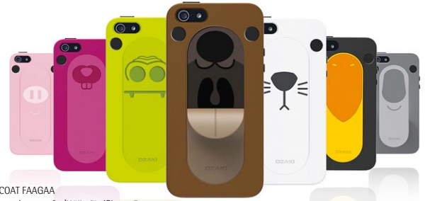
OICOAT FAAGAA Protective case for/Hülle für iPhone 5 by Ozaki International (In-house Design: Freeman Liu, Henry Mao) Award: Red Dot 2013