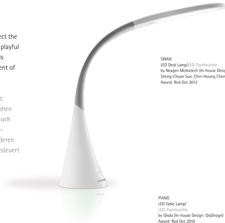
SWAN LED Desk Lamp/LED-Tischleuchte by Nexgen Mediatech (In-house Design: Sheng-Chyan Sun, Chin-Hsiung Chen) Award: Red Dot 2012

Weg vom reinen Funktionalismus und hin zu skulpturaler Anmut: Leuchten taiwanesischer Hersteller und Designer spiegeln die hohen Ansprüche einer zeitgemäßen Wohnkultur wider. Dabei finden auch spielerische Aspekte in der Gestaltung Berücksichtigung: Das Beleuchtungsfeld der Tischleuchte „Piano“ gleicht einer Klaviatur, deren Elemente an die Tasten eines Klaviers erinnern und einzeln angesteuert werden können.