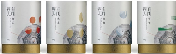
HEB HUMAN 18 Tea package/Teeverpackung by I'DER Visual Image Design Award: Red Dot 2014

Die taiwanesische Lebensart manifestiert sich auch im Verpackungsdesign. Am Point of Sale treffen Tradition und Moderne zusammen: Technologisch ausgefeilte Produkte werden mit Verpackungen präsentiert, die den traditionellen Formenkanon aufgreifen und die Identität des Landes unterstreichen.