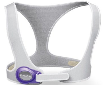
CARDIOCARE Cardiac Rehabilitation Monitor System/ Überwachungssystem in der Herzrehabilitation by Taiwan Textile Research Institute (In-house Design & Design: Nova Design) Award: Red Dot 2014

Buddhist Compassion Relief Tzu-Chi Foundation | Ho International Design | Nova Design | TWO+ GROUP